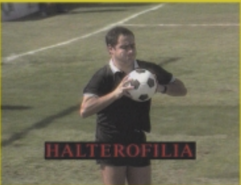
GRAN PREMIO DEL FESTIVAL 1992