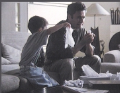
CINE/TV GRAN PREMIO DEL FESTIVAL 1993