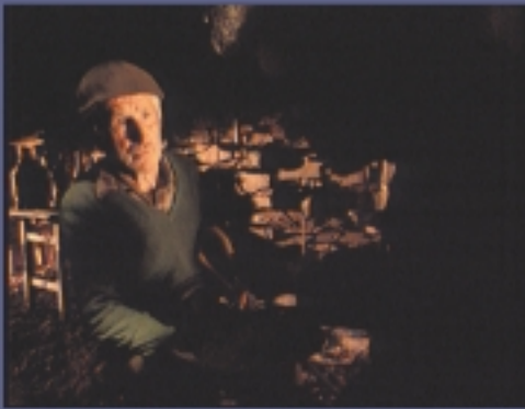
CINE/TV GRAN PREMIO DEL FESTIVAL 1994