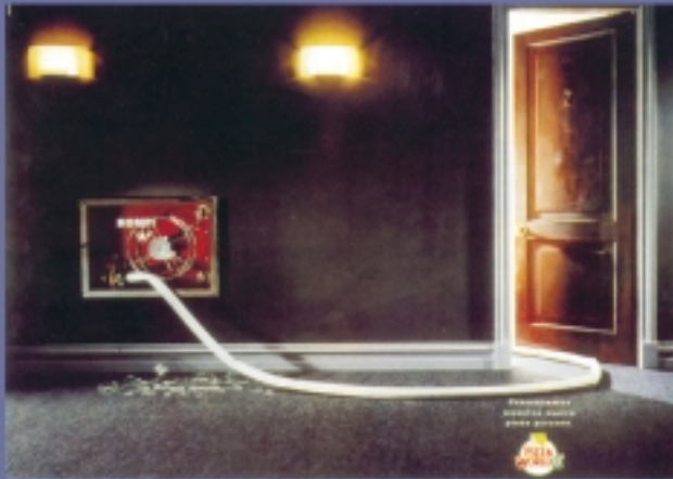
GRAFICA GRAN PREMIO DEL FESTIVAL 1994